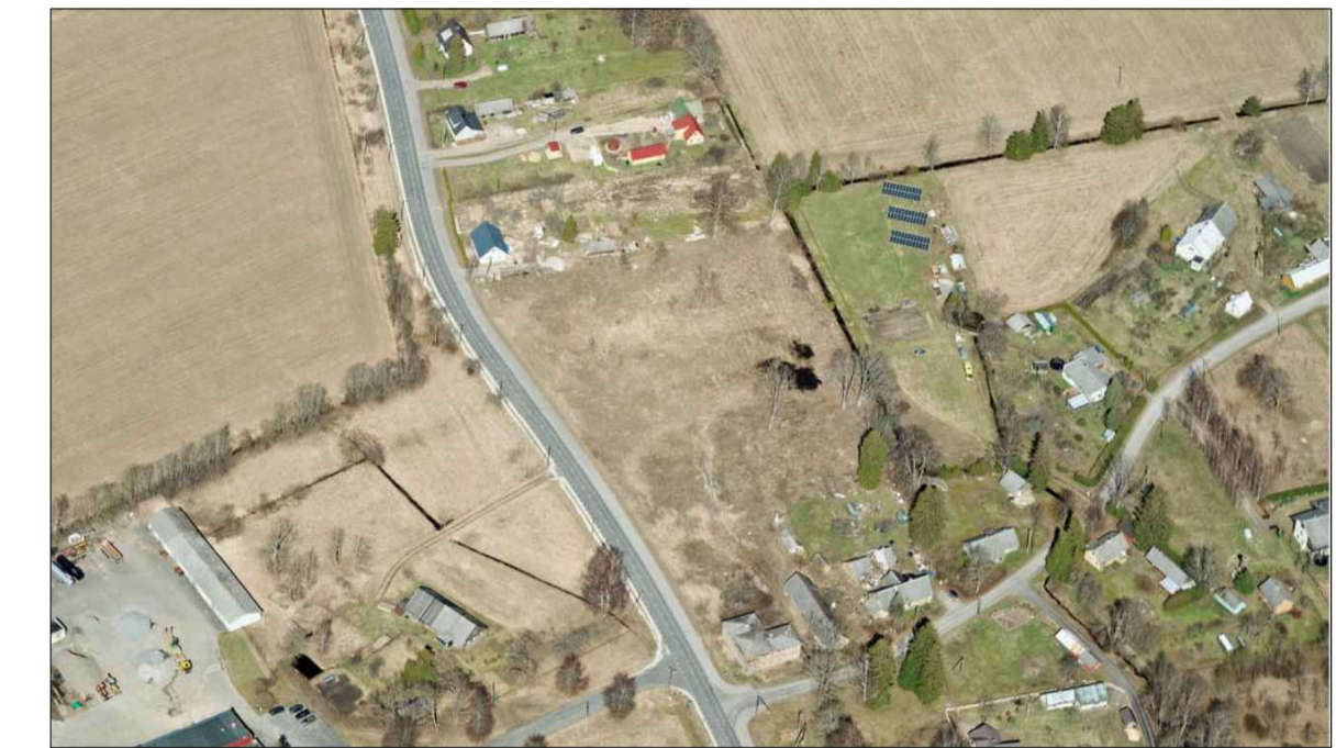
(pildistatud 20.04.2022)