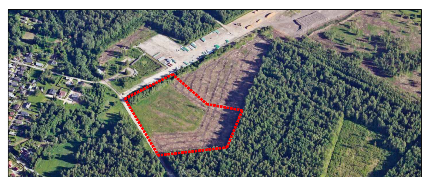
Pildistatud 09.06.2023.

Märksused: *Planeeringu koostamise alajätkuriks on 21.11.2021 mõeldistatud geodeetiline alusplaan täpsusastmega 1:500. Koostaja OÜ Geotite (Registrikood 10185147), 100 nr 21118. Koordinaadid Lambert-EST 97 süsteemis. Kõrgused EHK2000 süsteemis. *Planeeringuala suurus on ligikaudu 5,7 ha.