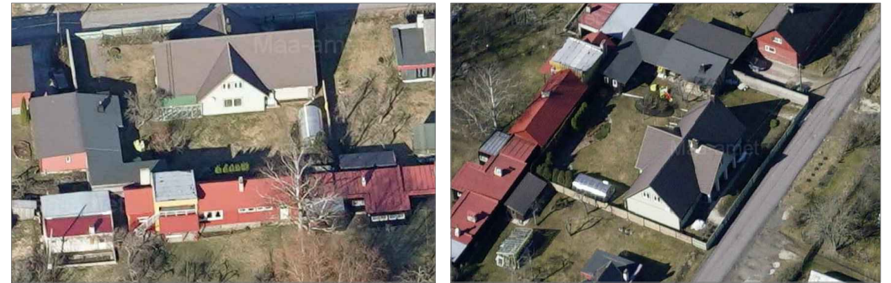
Fotod planeeritavast alast.